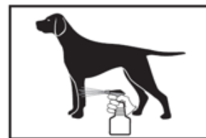
6. Pulvériser sur un gant pour traiter la tête.