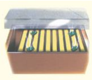
Fig. 4 Refermer la ruche et laisser agir le produit pendant 7 jours. Répéter ce traitement 4 fois avec les autres plaquettes et enlever les résidus éventuels à la fin du traitement.