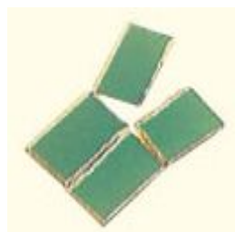
Fig. 2 Prendre une des deux plaquettes et la diviser en 3 ou 4 morceaux