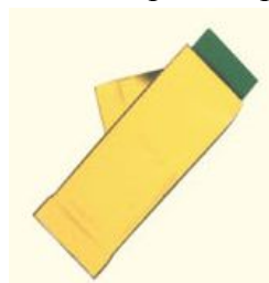
Fig. 1 Ouvrir le sachet contenant les deux plaquettes.

L'utilisation du produit n'est pas recommandée dans les ruches à plusieurs corps car son efficacité peut ne pas être satisfaisante.