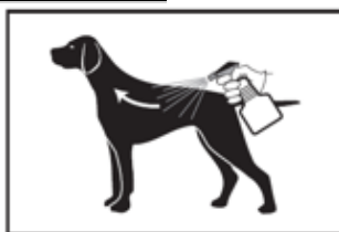
2. Pulvériser dans le sens inverse de la pousse du poil en tenant le chien.