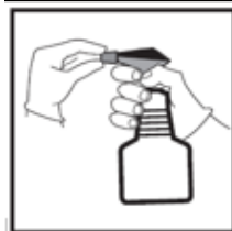
1. Ajuster l'embout.